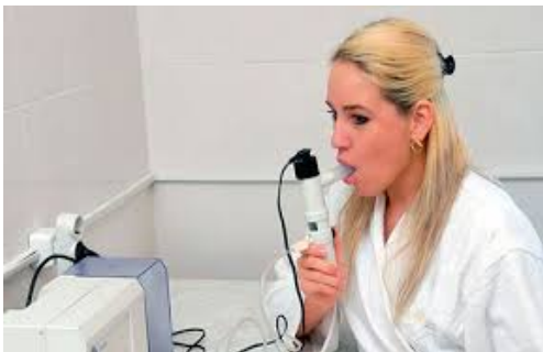
Рис.№7 Небулайзерная терапия

Введение лекарственных средств через небулайзер (пациенты с самостоятельным дыханием) - Небулайзеры напрямую связаны с аэрозольной и поэтому потенциально увеличивают риск передачи SARS-CoV-2. У пациентов с подозрением или документированным COVID-19 распыляемая бронходилатационная терапия должна назначаться только для лечения острого бронхоспазма (приступ бронхиальной астмы или обострение хронической обструктивной болезни легких [ХОБЛ]). В противном случае следует избегать распыляемой терапии, особенно при назначении без четкой доказательной базы; однако некоторые применения (например, гипертонический раствор при муковисцидозе) могут потребоваться индивидуально. Дозированный аэрозольный ингалятор (ДАИ) с дистанционными устройствами следует использовать вместо распылителей для лечения хронических состояний (например, для лечения астмы или лечения ХОБЛ). Пациенты могут использовать свои собственные ДАИ, если в больнице их нет.