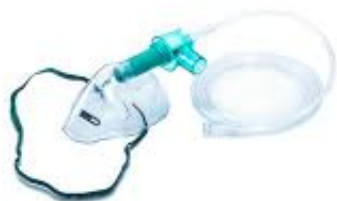
Рис.№1 Маска «Вентури»

Высокопоточную оксигенотерапию можно применять, используя простую лицевую маску, маску Вентури или бесклапанную маску (скорость потока 10-20 л / мин). Но некоторые эксперты предположили что, пациенты к которым подача кислорода осуществлялась через носовые канюли и маски (например, во время транспортировки) по мере увеличения потока кислорода, возрастал и риск рассеивания вируса, что увеличивает загрязнение окружающей среды для персонала, хотя это считается только теорией и данных подтверждающих это нет.