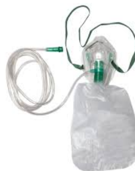
Рис.№2 Бесклапанная маска

Пациенты с высокими потребностями в кислороде - по мере прогрессирования заболевания и ухудшения состояния пациента возрастает и потребность в увеличении скорости подачи кислорода. На данный момент для пациентов без COVID-19 имеется два варианта решения проблемы: высокопоточная оксигенотерапия (ВПОТ) или начало неинвазивной вентиляции легких (НИВЛ). Тем не менее, у пациентов с COVID-19 это решение является спорным и подлежит продолжению обсуждения [40,41]. Несмотря на это противоречие, оба способа использовались в мировой практике по-разному. В ретроспективных когортных исследованиях показатели использования ВПОТ варьировались от 14% до 63%, в то время как от 11% до 56% пациенты получали НИВЛ [5,6,7]. Тем не менее, нет данных, описывающих, были ли эти методы успешными и на сколько они снизили необходимость применения инвазивной вентиляции легких (ИВЛ).