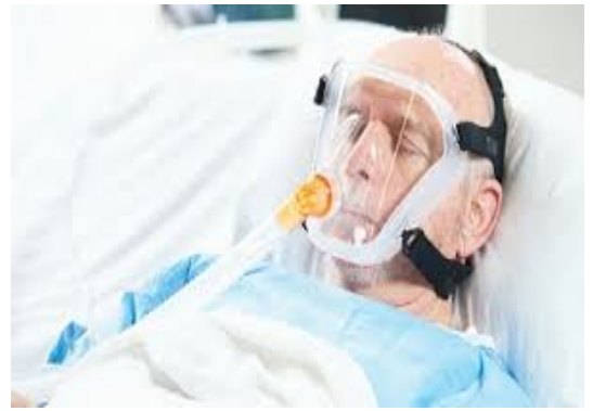
Рис.№6 Полно – лицевая маска

Введение лекарственных средств через небулайзер (пациенты с самостоятельным дыханием) - Небулайзеры напрямую связаны с аэрозольной и поэтому потенциально увеличивают риск передачи SARS-CoV-2. У пациентов с подозрением или документированным COVID-19 распыляемая бронходилатационная терапия должна назначаться только для лечения острого бронхоспазма (приступ бронхиальной астмы или обострение хронической обструктивной болезни легких [ХОБЛ]). В противном случае следует избегать распыляемой терапии, особенно при назначении без четкой доказательной базы; однако некоторые применения (например, гипертонический раствор при муковисцидозе) могут потребоваться индивидуально. Дозированный аэрозольный ингалятор (ДАИ) с дистанционными устройствами следует использовать вместо распылителей для лечения хронических состояний (например, для лечения астмы или лечения ХОБЛ). Пациенты могут использовать свои собственные ДАИ, если в больнице их нет.