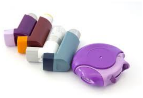
Рис.№8 Дозированный аэрозольный ингалятор (ДАИ)

Если используется небулайзерная терапия, пациенты должны находиться в комнате для изоляции от инфекций, передающихся воздушно-капельным путем, а медицинский персонал должен использовать меры предосторожности с соответствующими средствами индивидуальной защиты (СИЗ); это включает в себя маску N95 с защитными очками и