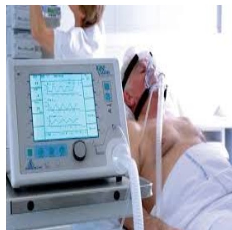
Рис. №4 НИВЛ

Решение начать неинвазивные методы как ВПОТ или НИВЛ, должно быть принято путем учета отрицательных и положительных эффектов для пациента, риска воздействия на медицинский персонал и наилучшего использования ресурсов и выбранный подход следует пересматривать по мере появления новых данных. Во всем мире ведется разработка новых клинических, междисциплинарных подходов, который включает команду пульмонологов и других специалистов, чтобы облегчить выбор метода помощи тяжелым пациентам. Пациентов с COVID-19, у которых прогрессирует острая дыхательная недостаточность, предпочтительно необходимо обеспечить высокопоточной оксигенотерапией, нежели обычной кислородотерапией. Предполагается, что неинвазивные методы необходимо использовать избирательно, и не переходить непосредственно к интубации пациентов (например, если пациент молод и без сопутствующих заболеваний). С другой стороны, некоторые пациенты нуждаются в ранней интубации а не ВПОТ (например, пожилой пациент с нарушениями сознания, сопутствующими заболеваниями и несколькими факторами риска прогрессирования).