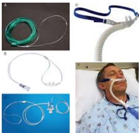
Рис. №3 ВПОТ